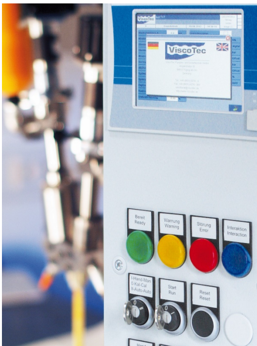
Bild 4: Bei dieser speziell entwickelten 2K-Dosiersteuerung lassen sich mit Hilfe der eingebundenen Rezeptverwaltung unterschiedliche Mischungsverhältnisse und somit Produkteigenschaften voreinstellen, hinterlegen und mit wenigen Klicks über das Touchpanel aufrufen.

Verfügbar sind zusätzlich Parameter zur Angabe der Material Pot-Life, zur Einstellung der Spülschusswartedauer und ein Spülschusszähler. Falls innerhalb der eingestellten Pot-Life nicht mindestens das x-fache des Füllvolumens des statischen Mixers dosiert wurde, erfolgt eine Fehlermeldung durch das System. Damit wird sichergestellt, dass kein bereits reagierendes Material verwendet wird oder sogar der statische Mischer aushärtet. Mit Nutzung des Parameters für die Spülschusswartedauer kann vor Ablauf der Pot-Life durch die Steuerung ein Spülschuss ausgelöst werden. Über eine Signalausgabe an eine externe Steuerung kann durch das Handling-System eine für den Spülschuss definierte