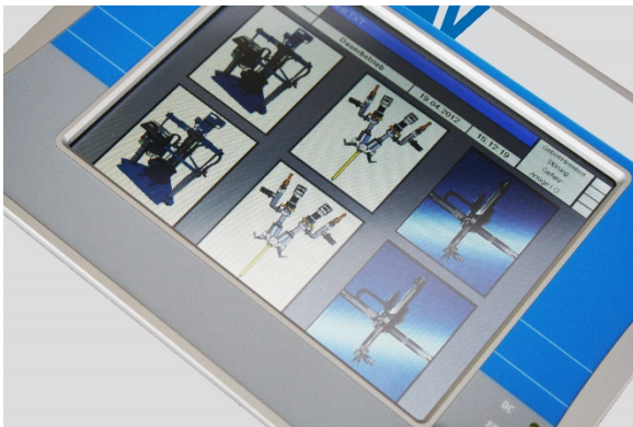
Bild3: Multifunktionales Touchpanel

Die verwendete Exzenterpumpen-Technologie arbeitet strikt volumetrisch. Mit jeder Pumpenumdrehung wird immer ein fest definiertes Medienvolumen dosiert; mit einer definierten Drehzahl in U pro Zeiteinheit wird eine Fördermenge in ml pro Zeiteinheit festgelegt. Es besteht eine lineare Übereinstimmung zwischen Dispenser-Drehzahl und Dosiermenge, d.h. doppelte Drehzahl bewirkt verzögerungsfrei doppeltes Fördervolumen. Diese Volumengenauigkeit wird bei den Systemen höchst zuverlässig und pulsationsfrei auch bei schwankenden Viskositätswerten erreicht. Bei dem beschriebenen 2K-Dosiersystem ergibt sich aus der Fördermenge pro Kanal das gewünschte Mischungsverhältnis für das 2-Komponenten Silikon. Die Motordrehzahl der Dispenserantriebe wird über ein Analogsignal gesteuert. Die Austragsmenge wird volumengenau und direkt linear zum eingestellten analogen Steuersignal am Pumpenausgang zur Verfügung gestellt. Durch dieses Funktionsprinzip bietet das System die technische Möglichkeit, die Dosiermenge pro Zeiteinheit zu jedem Zeitpunkt des Dosierprozesses stufenlos zu verändern und Mengenprofile einzusetzen – für eine variable Gestaltung der Mischungsverhältnisse beim Medienaustrag.