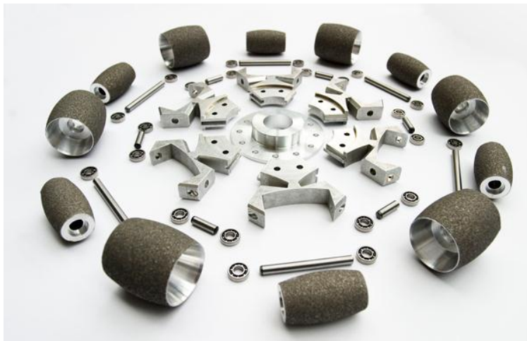
Abbildung 4 Omniwheel in Einzelteilen