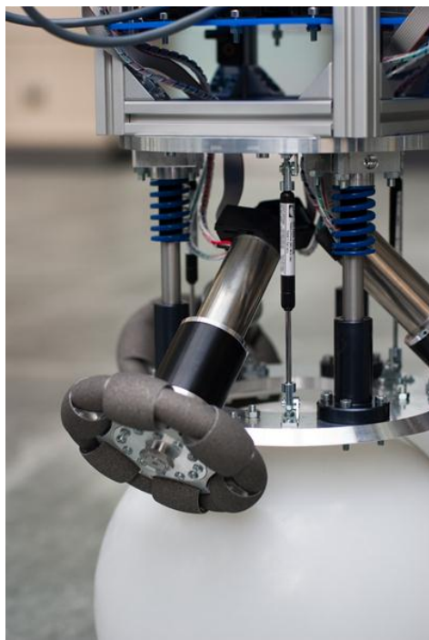
Abbildung 5 Antrieb: Motor EC-4pole 30, Planetengetriebe GP 42 C, Winkelencoder HEDL 5540, Omniwheel

Auch die drei im 120°-Winkel um die Kugel angeordneten Omniwheels sind eine Eigenentwicklung. Denn auf dem Markt verfügbare Lösungen konnten dem Anspruch auf eine gänzlich geschlossene Aussenkontur nicht genügen. Ihre aufwändige Geometrie, die verlustarme Auslegung der einzelnen Teile und die auf Kraftübertragung optimierte Oberfläche resultieren in einer aussergewöhnlichen, hochwertigen Konstruktion. Angetrieben werden die Räder durch Motor/Getriebe-Kombinationen von maxon motor. Sie bestehen jeweils aus einem maxon EC-4pole 30 3 , einem Planetengetriebe GP 42 C 4 und Winkelencoder HEDL 5540 5 . Die Aufhängung der Antriebe ist so gestaltet, dass die Kugel optimal unter den drei Omniwheels liegt und stets Kraftschluss besteht. Geregelt werden die Antriebe über maxon-