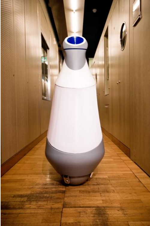
Abbildung 1 Rezero in Aktion

Ein interdisziplinäres Team von Studierenden hat auf beeindruckende Weise in die Realität umgesetzt, was sich auf Anhieb etwas gar verrückt anhört und eigentlich grundlegenden physikalischen Gesetzen zu widersprechen scheint. Ihr Ballbot 1 „Rezero“ schafft nicht nur den Balanceakt auf der Kugel in höchster Vollendung, sondern besticht ebenso durch überzeugende technische Lösungen, beispielelose Agilität und ästhetische Formgebung.